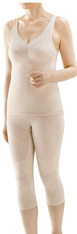
『健脚ウォーカー』DGL・510 (ベージュ)

『健脚ウォーカー』は、全国の百貨店で発売し2014年秋冬シーズン約1000枚の売り上げを目指します。(2014年8月～2015年1月)