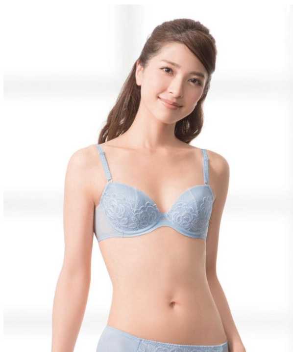
写真の商品：ブラジャー KB-2341（カラー：TU ターコイズ）