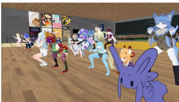
『みんながいるから限界を超えられる 限界！スクワット部』 (投稿者：星麦しげ氏)