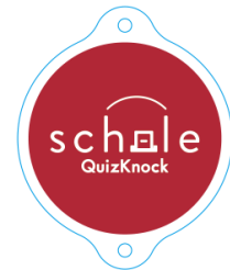
オリジナルアクリルキーホルダー

QuizKnock scholeの開設を記念して、早期入会いただいた方を対象に特別な特典があります。