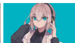
マーシャルマキシマイザー