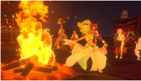
『焚火を囲んでみんな野生に返るひと時』 (投稿者：damakoko 氏)

アバター同士の交流やアバターならではの活動が伝わる最高のショットを評価する新設の「アバターライフ部門」。応募作品 40 点の中から選ばれた栄えある初代受賞は『焚火を囲んでみんな野生に返るひと時』（投稿者：damakoko 氏）です。