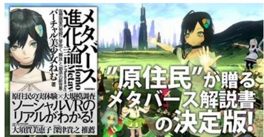
『メタバース進化論』（著者：バーチャル美少女ねむ）

「バーチャル美少女ねむ」は、バーチャルでなりたい自分になる【人類美少女計画】をテーマに活動している自称・世界最古の個人系 VTuber です。2022 年春には書籍『メタバース進化論』を出版。同書では、自分自身の体験や数多くのユーザーへのインタビュー、そして全世界のユーザー1,200 名を分析した大規模調査「ソーシャル VR 国勢調査」を元にメタバースのリアルを明らかにしました。そのような、世界初の「仮想世界のルポルターージュ」を通して、アバター文化について広く詳しく紹介した功績を称え、表彰しました。