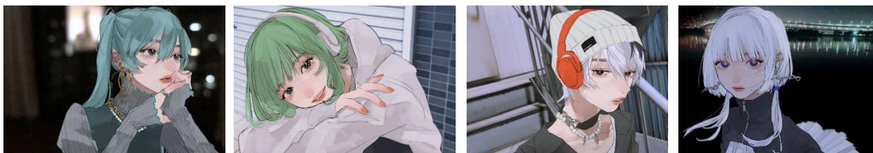
Art by tamimoon © CFM、© INTERNET Co., Ltd.、© Gynoid.、© KAMITSUBAKI STUDIO

今回のボカコレ特設サイトのアートワークは、2020年より活動開始し、瞬間に話題となった新進気鋭のイラストレーターtamimoonによる描きおろしボカロキャラクターになります。テーマは『日常の中の、音楽のある風景』。本アートワークは、「ボカコレ2022春」の投稿企画の作品のアートワークとして使用可能で、本日より特設サイトで配布を開始します。