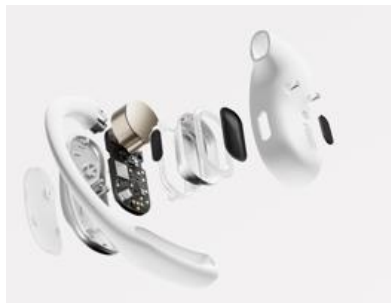
コンポジットダイアフラム