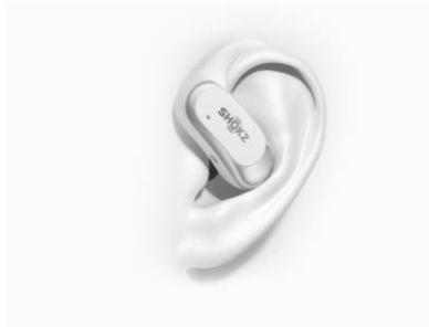
デュアル・ベベル・デザインフィット