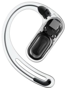
柔軟なニッケルチタン形状記憶合金製

Shokz Labの優れた開発者たちによって生み出された、人間工学に基づいたデュアル・ベベル・デザインは、広範囲な研究と度重なるテストを通じて、単なるフィット感ではなく、揺るぎない、安全で安定したフィット感、正面から見た時にスマートになるよう設計いたしました。超極細0.75mmの柔軟な形状記憶特性を持つニッケルチタン合金と、ソフトなシリコンで仕上げた「Airイヤーフック」が、圧倒的なフィット感を提供いたします。また、ティアドロップ型のデザインを採用したイヤーフックは、耳下部分を広くし、長時間の使用でも圧迫感を最小限に抑えます。さらに、上部分を小さくすることで、メガネを着用したままでも快適にご利用いただけます。