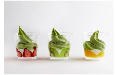
ホテルヴィスキオ京都 「お米ソースのカップパフェ」

7/14(日)～16(火)、21(日)～23(火)、8/16(金) うちわの提供