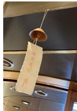
ホテルグランヴィア岡山 「備前焼風鈴」