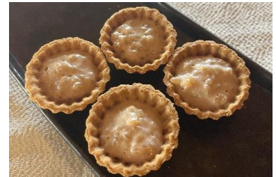
奈良ホテル 「ライスブディング」