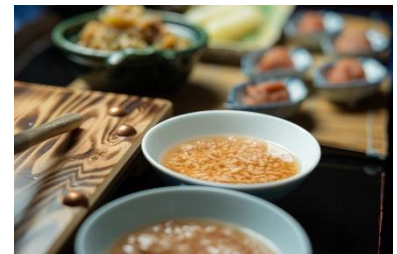
ホテルグランヴィア和歌山 「冷やし茶粥」