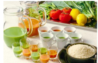
ホテルグランヴィア大阪 「お米とお野菜の冷製スープ」