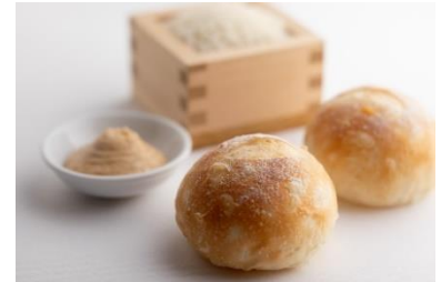
ホテルグランヴィア京都 「ごはんパン」

7/14(日)～16(火)、21(日)～23(火)、8/16(金) うちわの提供