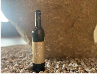
純米大吟醸「ええじかん」イメージ