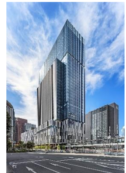
建物外観（JPタワー大阪） イメージ