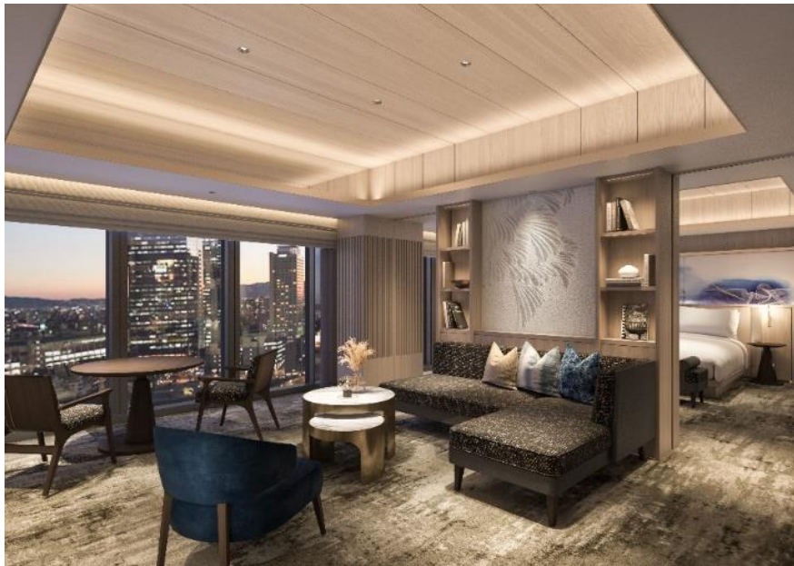
SPECIALTY SUITE イメージ