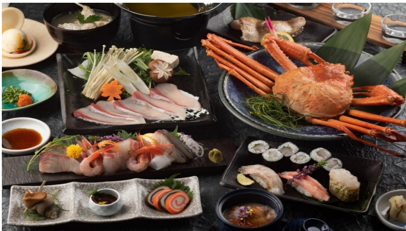
【富山の“美”を心ゆくまで堪能 1泊2食付 宿泊プラン】夕食イメージ

本プランはJRグループが共同で2024年10月～12月に開催する「北陸デスティネーションキャンペーン」*を見据えて開催される「Japanese Beauty Hokuriku キャンペーン」のテーマである5つの「 美 」を体験いただけるプランとして期間限定で販売いたします。