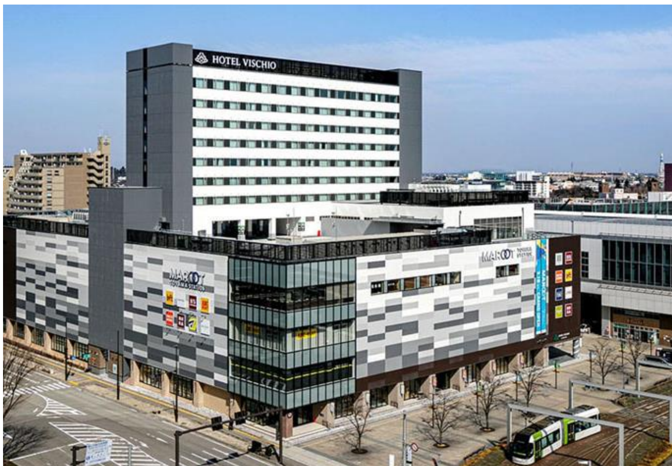
ホテルヴィスキオ富山（JR富山駅ビル）全景

「ホテルヴィスキオ富山」は、JR西日本ホテルズの宿泊主体型「ホテルヴィスキオ」ブランドとして、大阪、尼崎、京都に続く4号店として、富山駅南口徒歩1分という抜群の利便性を誇る「JR富山駅ビル」上層階（4階一部及び5階～12階）に、ランドマークホテルとして2022年3月18日に開業しました。お客様に寄り添う～3つの「B」（BED・BATH・BREAKFAST）～をキャッチフレーズに「JR西日本ホテルズ」のフラッグシップホテルである「ホテルグランヴィア京都」が運営を行い、「ホテルグランヴィア」と同グレードの上質なベッドアイテム、大浴場と快適な客室内バスルーム、地元食材を使った「富山」ならではの朝食など、“グランヴィア”クオリティの上質な施設と選び抜いたスマートなサービスを提供しており、開業以来多くのお客様にご好評をいただいています。