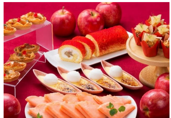
高野りんごを使用したスイーツイメージ