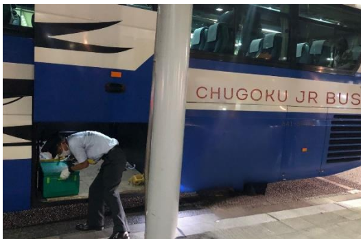
貨客混載バスが広島駅に到着した様子

貨客混載の取り組みは、庄原市と西日本旅客鉄道株式会社 広島支社により2018年に開始され庄原市高野町の認知度向上（エリアブランディング）や地域製品の消費拡大を通じた、地域活性化事業です。