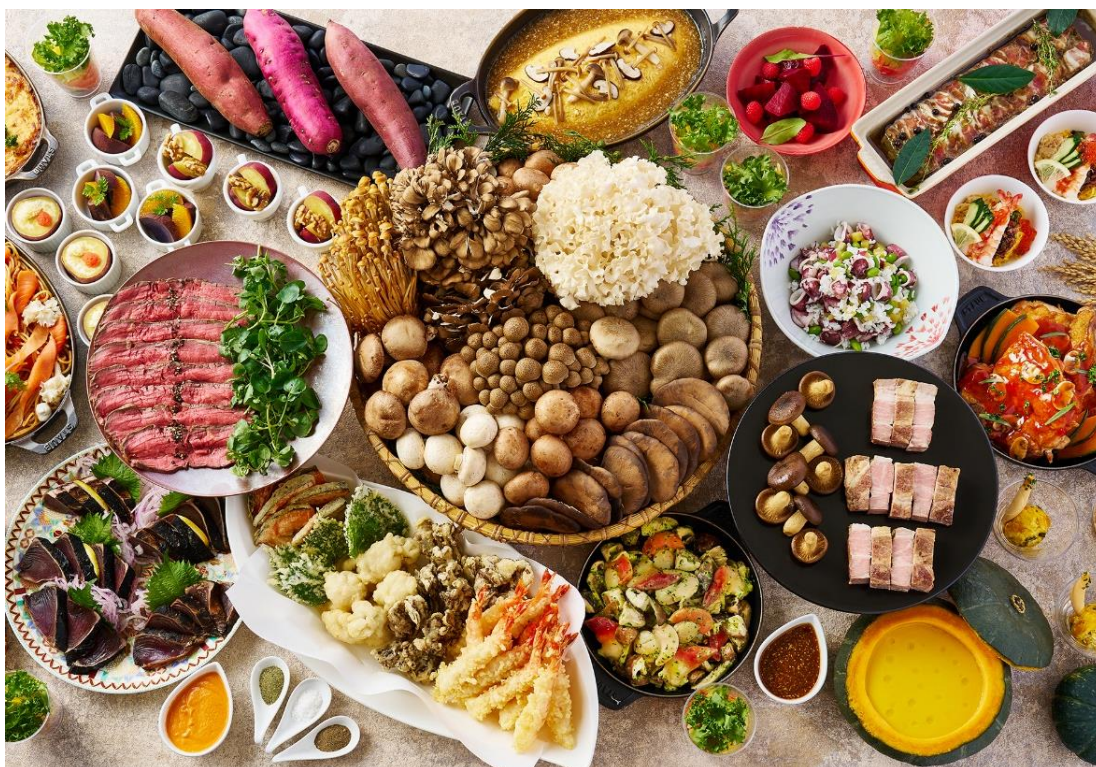
画像：『開業記念』秋の味覚ディナーバイキング 料理集合イメージ

さらに、なんと金時の蒸籠蒸しや紅はるかとクルミのロースト、紫さつまいもの冷製料理、かぼちゃのスープやサラダなど、秋の人気食材「芋」「南瓜」をつかったメニューも充実しています。