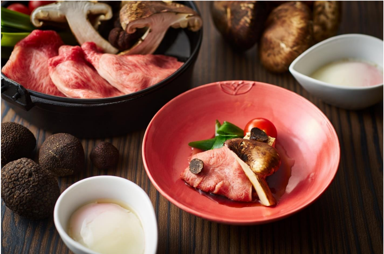
画像：近江牛のすき焼き～松茸とトリュフ風味～イメージ

今回のバイキングメニューは、秋に食べたいキノコがテーマ。松茸の他、大黒本しめじや、はなびら茸、九頭竜マイタケといった多種類のキノコが各メニューに散りばめられています。中でもおすすめは、牛肉と大黒本しめじの鉄板焼きで、目の前で焼き上げるパフォーマンスとともにお楽しみいただけます。