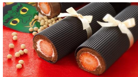
画像：あまおう苺の恵方ロールイメージ

※写真はイメージです ※王道の恵方巻・伊勢海老の恵方巻ともに山葵を使用しております。お子様をはじめ山葵が苦手な方はご注意ください