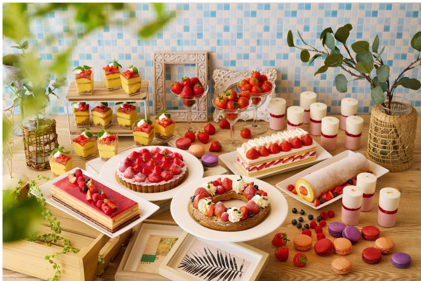
画像：苺づくしのスイーツバイキング メニューイメージ

小学生以上のお客様へ一皿ずつご提供する“しぼりたて苺モンブラン”も合わせて、この時季だけの苺メニューを存分にご堪能ください。