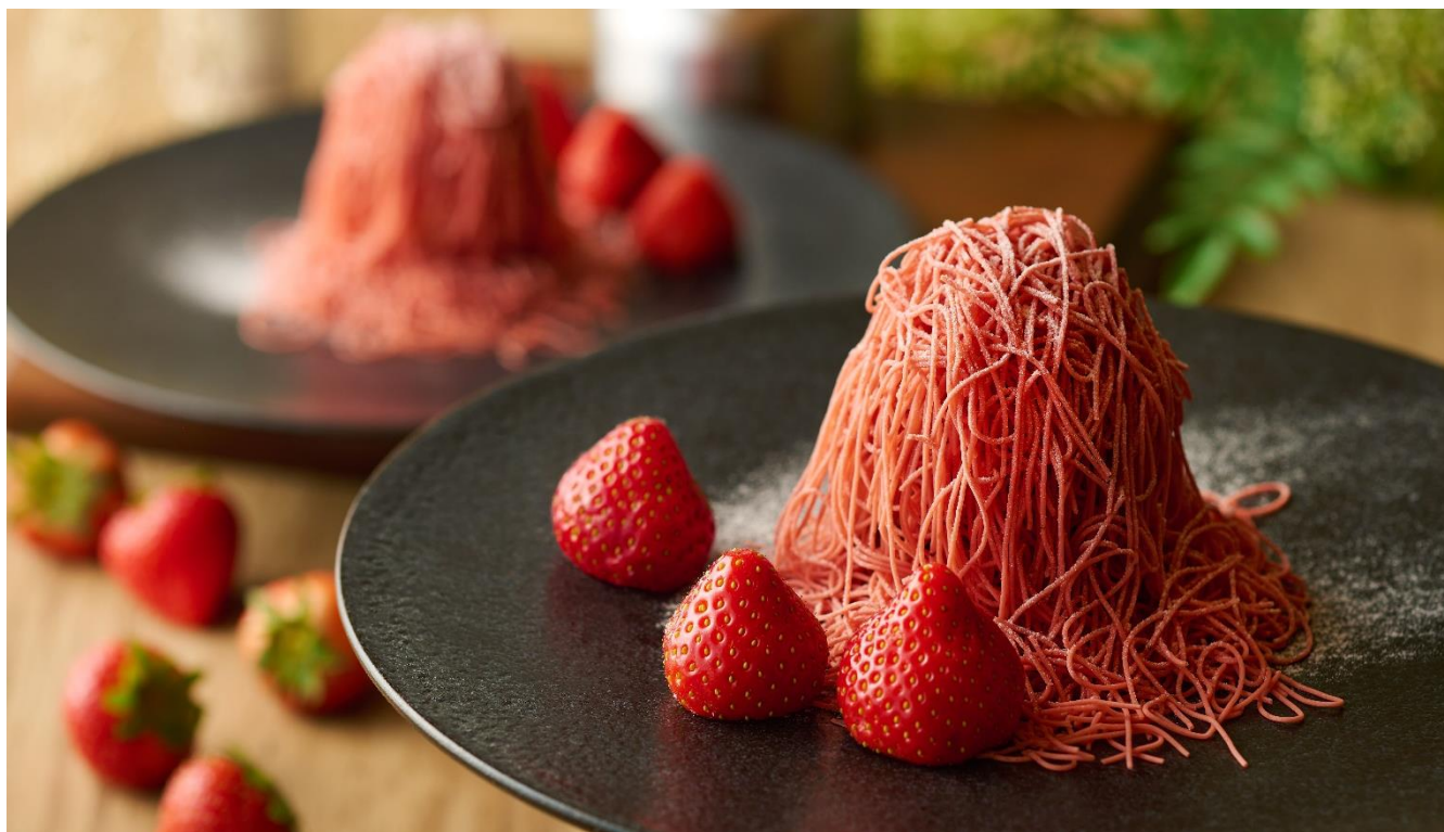
画像：シェフの一皿「しぼりたて苺モンブラン」イメージ

毎年人気のメニュー「フレッシュ苺の食べ放題」を今年も実施し、お好きなだけ苺をご堪能いただけます。バイキング台には、苺のタルトや、ミルフィーユ、シフォンケーキなどパティシエが考案した苺スイーツが並びます。パスタ、ピザ、カレー、飲茶など軽食も充実しておりますので遅めのランチとしてもご利用いただけます。