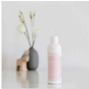
ベビーローション