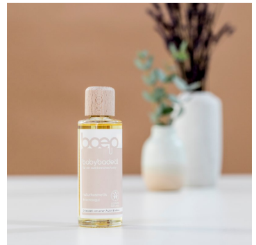
ベビースバスオイル