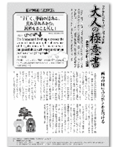
フジテレビKIDSコラボページ