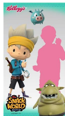
<AR フォトフレーム使用時のイメージ>