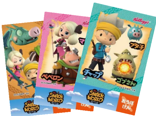
<ケロッグオリジナル スナックワールドシール>

期間限定パッケージ 1箱につき1枚、“ケロッグオリジナル スナックワールドシール”が入っています。シールは全3種類で、「スナックワールド」のキャラクターがデザインされたシールになっています。スマートフォンに無料アプリ“aug!”をダウンロードして起動し、シールをかざすと画面上にキャラクターが表示されて、一緒に写真を撮って遊べる仕掛けが施されています。ランダムでレアな「かくしフレーム」も出てくるかも！？