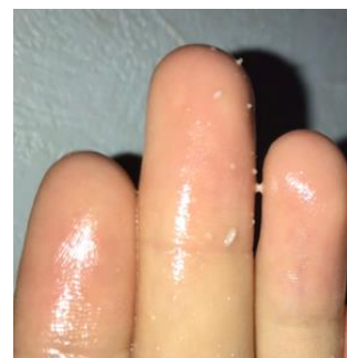
※使用後に落ちる汚れ