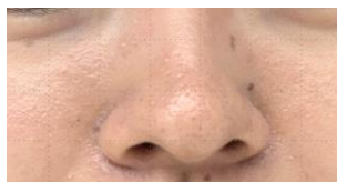
※ピンクハーブクレンジング1週間使用后