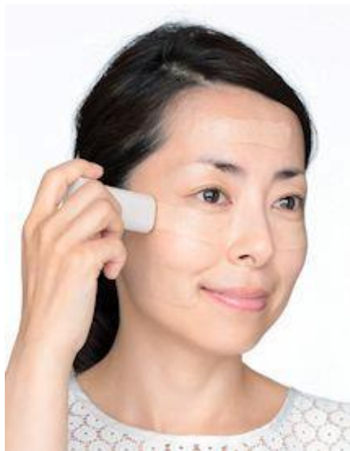
スティック状なので簡単に肌にのせられる

BBクリームは、日焼け止め、化粧下地、美容液、ファンデーションなどの機能が1つになったベースメイクです。もとは韓国の化粧品で発売されたのをきっかけに話題となり、2008年には化粧品メーカー各社が商品化して日本でも大ヒットとなりました。BBクリームが人気となったのは、1つでベースメイクが完成する手軽さです。