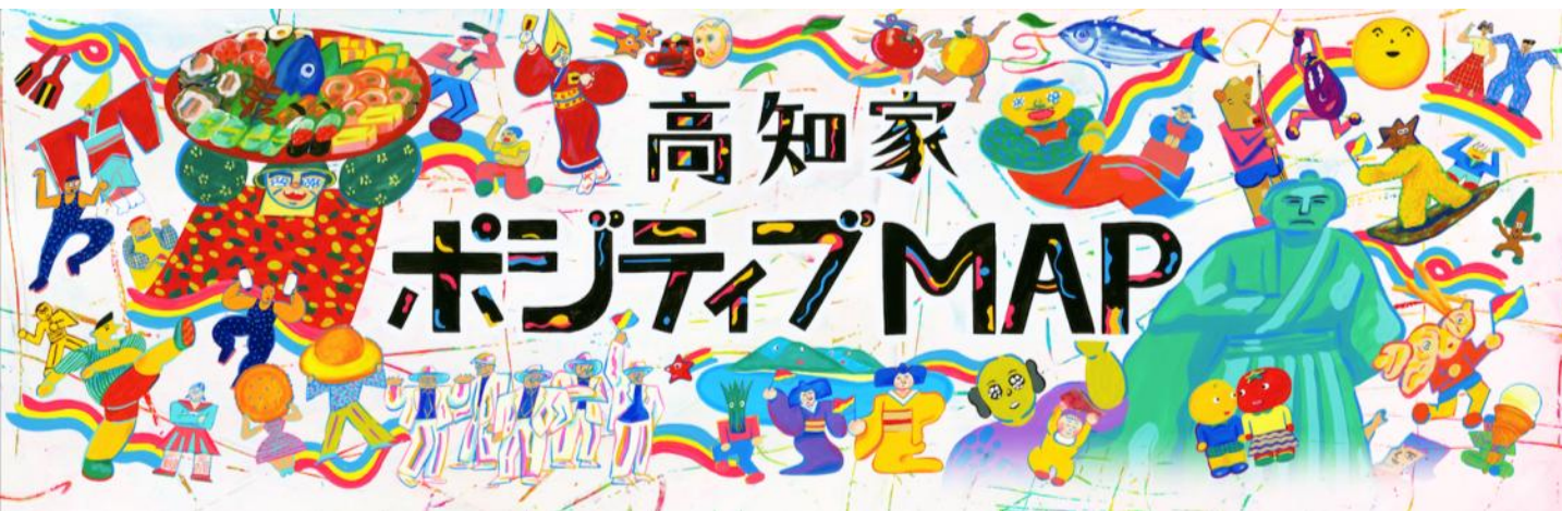
▲高知家ポジティブMAPページのトップビジュアル。イラストはひめだまなぶ氏（※）

高知県の情報発信として「高知家（こうちけ）」プロモーション活動を展開している一般財団法人 高知県地産外商公社（事務所：東京都中央区 代表者：門田登志和）は、今年度、「高知家には、ポジティブカがある。」をキャッチフレーズに、県内中のポジティブな気質・食べ物・場所・風習・ストーリーなどを募集する「高知家 ポジティブ・コレクション」を行なっています。本日、11月30日（水）より、高知県民自らが推奨する情報をまとめた「高知家ポジティブMAP」を高知家サイトにて公開します。