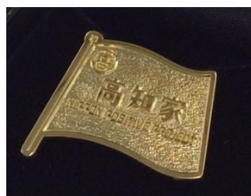
▲MVPP選出者に贈呈される、限定特製ゴールドポジティブピンバッジ

第2回 URL : www.kochike.pref.kochi.lg.jp/~top/positive-news/star/322/