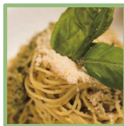
「緑」の気分のお料理