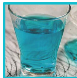
「青」の気分のドリンク