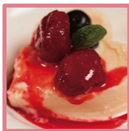
「赤」の気分のスイーツ