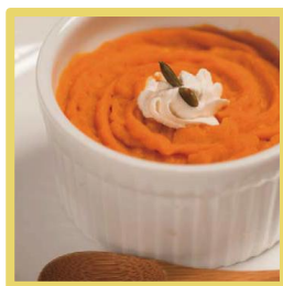
「黄色」の気分のスイーツ