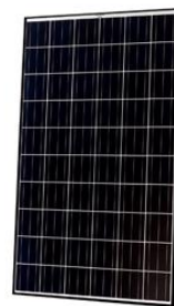
〈Q セルズ 太陽光パネル〉

http://www.q-cells.jp/pdf/PHOTONTest_20140307.pdf