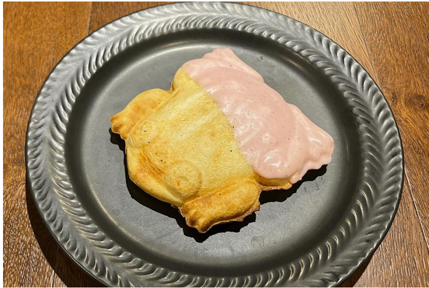
▲「カエル焼き (いちごチョコレート)」

魔女の谷にあるレストラン「空飛ぶオープン」の屋台では、たい焼きならぬ「カエル焼き」を販売しています。旬のいちごとバレンタインにちなみチョコレートを取り入れた新味を2月5日(水)～3月31日(月)の期間限定でお楽しみいただけます。