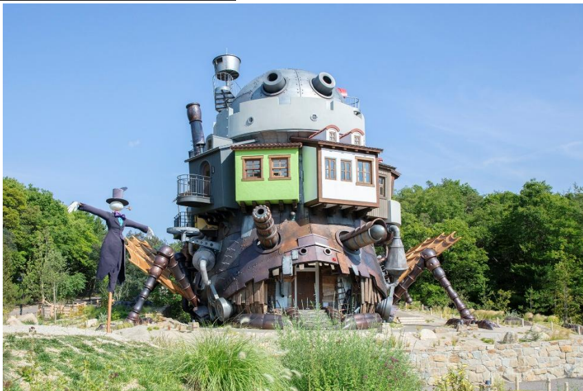
▲魔女の谷にある「ハウルの城」

『ハウルの動く城』が1月10日(金)21:00～23:34、日本テレビ系列の「金曜ロードショー」で放送される予定です。ジブリパークでは、魔女の谷に「ハウルの城」や「ハッター帽子店」といった作品に描かれた建物があります。