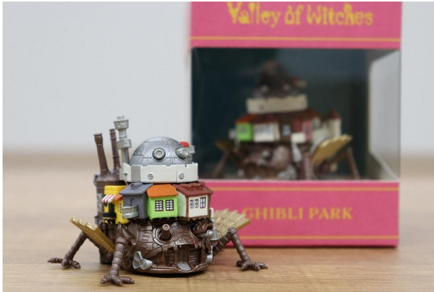
▲「13人の魔女団」で販売している「ハウルの城（ゼンマイ式）」

魔女の谷の「13人の魔女団」はエリアにちなんだ『ハウルの動く城』などのオリジナルグッズがそろったショップです。「ハウルの城（ゼンマイ式）」（3,300円）や「ポップアップカード／魔女の谷 ハウルの城」（1,430円）は昨年末に発売したばかりの新商品。「ハウルの城（ゼンマイ式）」は後ろのゼンマイを巻くと、城が動きます。ジブリパークを訪れた記念にいかがでしょうか。