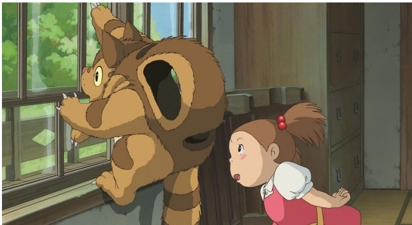
▲『めいとこねこバス』

ジブリの大倉庫の「映像展示室オリヲン座」ではスタジオジブリ制作の短編アニメーション映画を上映しています。来年1月の上映作品は『めいとこねこバス』（宮崎駿監督）です。