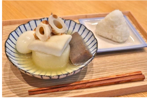
▲白いおでんと塩むすび

ジブリパークのある愛・地球博記念公園北口広場の「ロタンダ 風ヶ丘（かぜがおか）」はおにぎりや甘味などを味わえる和のカフェテリアです。2種のおでんが11月6日(水)より冬季限定で登場します。