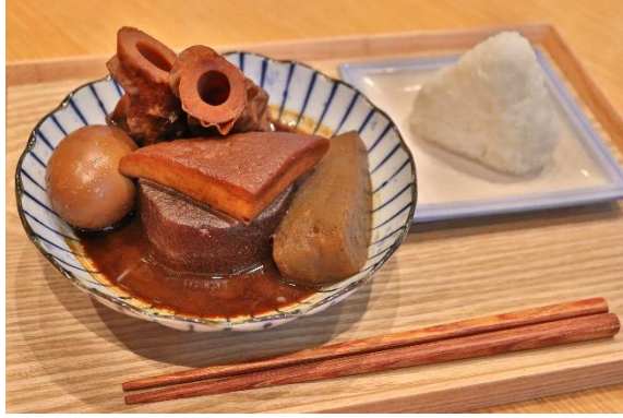
▲赤いおでんと塩むすび