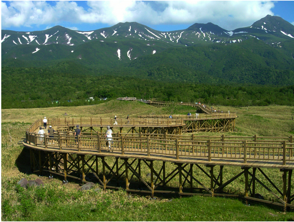
実績一例（北海道：知床五胡木製高架道路）