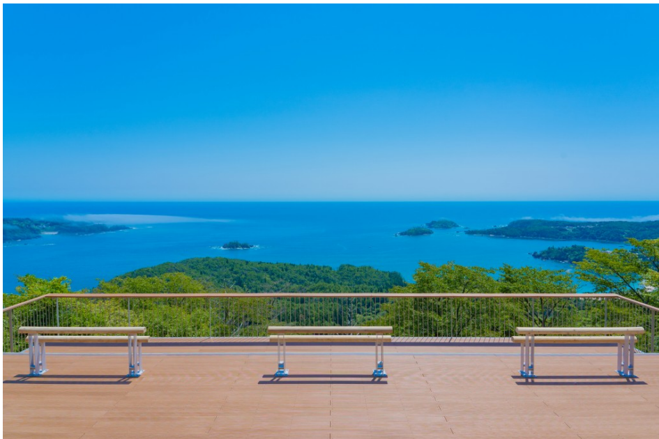
実績一例（宮城県：亀山展望デッキ）