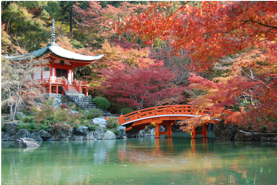
実績一例（醍醐寺和風木橋：京都府）