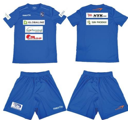
プラクティスシャツ