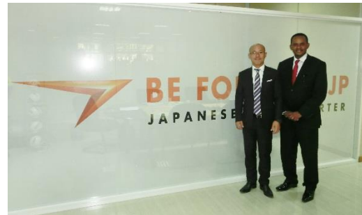
ザンビアポスト社長と当社代表