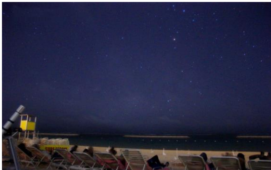
(写真:ツアーイメージ)

サトビーチは客室から歩いて移動できるため、小さなお子様がいるファミリーのお客様にも安心です。