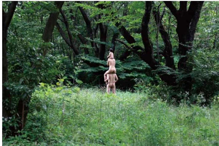
二藤建人「森の家族」インクジェットプリント/2015

株式会社 ZE エナジーが協賛する、EARTH+GALLERY (アースプラスギャラリー／東京都江東区木場) は、2016年8月6日(土)～8月21日(日)の期間、写真・ビデオ・絵画・デザイン・音楽などの手法を用いた国内外のアーティストたちが POWER を表現する展覧会「POWER TO THE PEOPLE」を開催いたします。