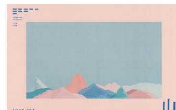
DM デザイン : 榎悠太

運営母体 : 株式会社 ZE エナジー ( http://www.ze-energy.net/ )