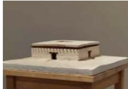
「白景色」/W300mm×D300mm×H150mm ミクストメディア