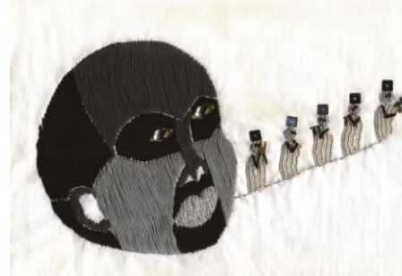
「空也 show 人」/297mm×2100mm/ 2016

本展覧会は、2015年11月に行われた第6回東京アンデパンダン展 ( http://earth-plus.net/?p=6473 ) の人気投票「入札アンデパンダン」で得票数2位の高星秀明と、3位の浅間明日美による2人展です。2人に共通するのは、石組などを用いた建築物の設計から影響を受けて作品を制作している点が上げられます。