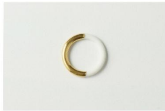
KODAMA TOKI □

「ON ZA LINE」の小玉清美によるソロプロジェクト「KODAMA TOKI」は主に石膏型を用いた陶磁器の制作を行う一人製陶所です。白磁の白を基調としたアクセサリーやテーブルウェアを作っています。