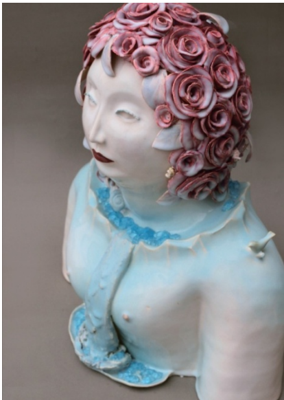
self-confidence / W430×L200×H340mm 2015

※water cycleとは、蒸発、降水、地表流、土壌への浸透など、地球における継続的な水の循環のこと。