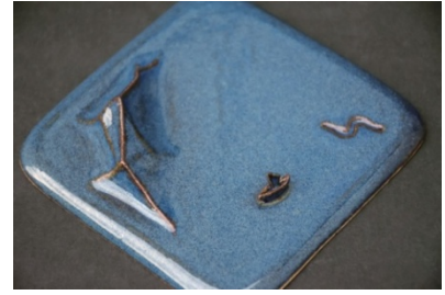
solution / W100×L30×H100mm 2014