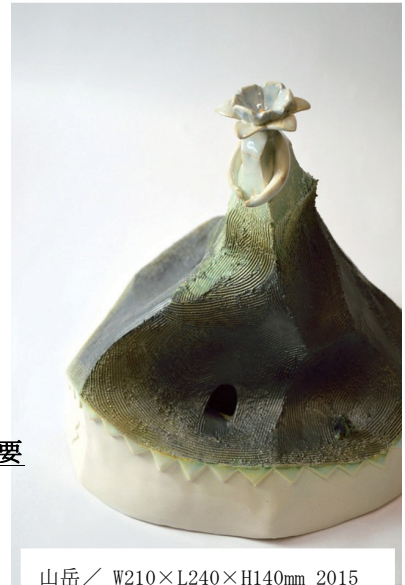
山岳 / W210×L240×H140mm 2015