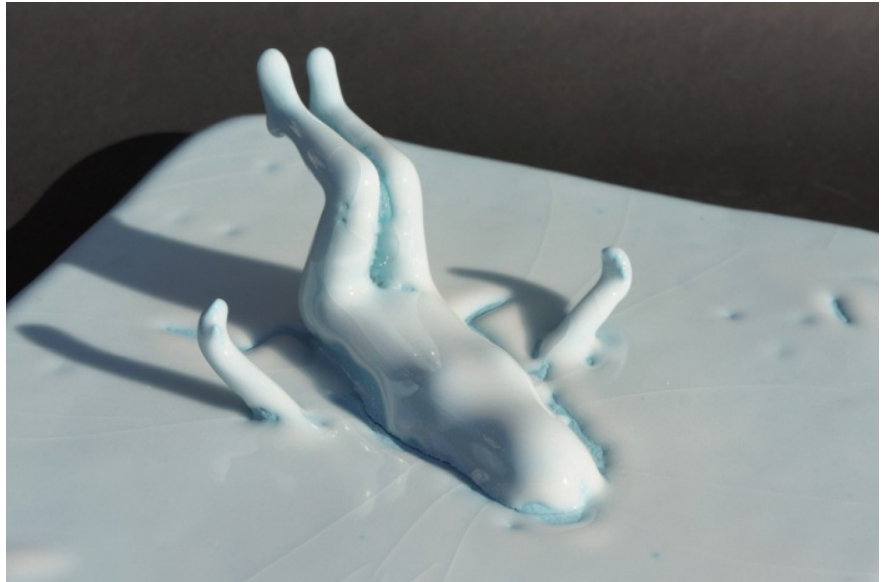
lake / W250×L250×H10-100mm 2014

小松冴果実は、表情豊かな人物のレリーフ*をはじめ、淡い色合いと女性のアンニュイな雰囲気を出した立体作品、タイルのような形状の陶に身体モチーフが溶け込んだ作品など、陶を素材に様々な造形を制作しています。