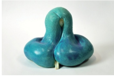
海雲(うみ) / W150×L155×H150mm