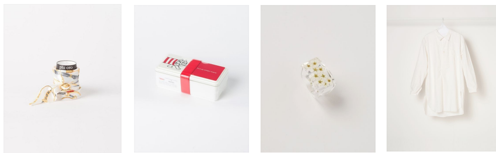
(画像 03) 「アイテムイメージ (左より) : piu oro 巻きスカーフ / Lisa Larson Mykey lunch Box / nooca リング (雪柳) DEADSTOCK スウェーデンシャツ」

また、期間中¥5,000 以上ご購入もしくは IROYA に会員登録頂いたお客様に、限定トートバックを配布致します。