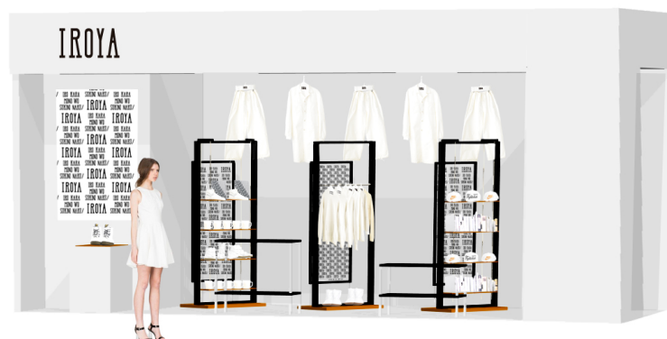
（画像 01） 「IROYA LAZONA+ 店舗イメージ」

場 所：ラゾーナ川崎プラザ 2F プラザ・イースト LAZONA+ （神奈川県川崎市幸区堀川町 72-1）