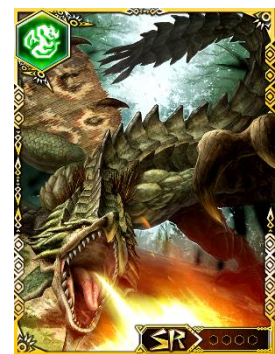
CM 放映記念ログインキャンペーンでもらえる 限定 Sレアカード『陸戦女王リオレイア』

また、テレビ CM は第二、三弾とシリーズ化される予定で、ゲーム内では期間中にログインすると、「クエPチャージ」、「レアガチャ券」、「強化像セット」、「アビ玉セット」、「Sレアガチャ券」等、豪華なゲーム内アイテムをプレゼントするキャンペーンを引き続き実施いたします。