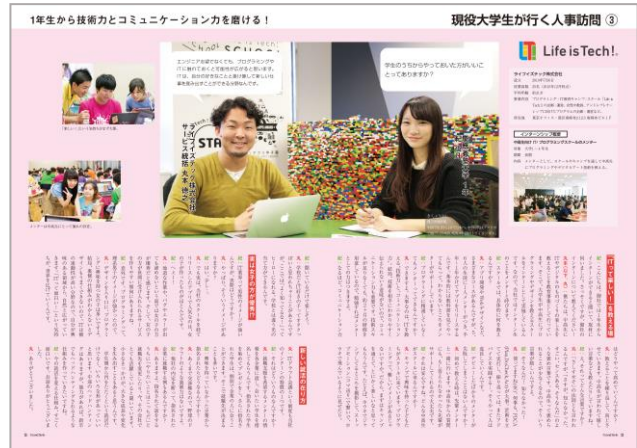
現役大学生が行く人事訪問