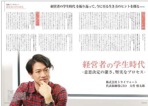
巻頭インタビュー