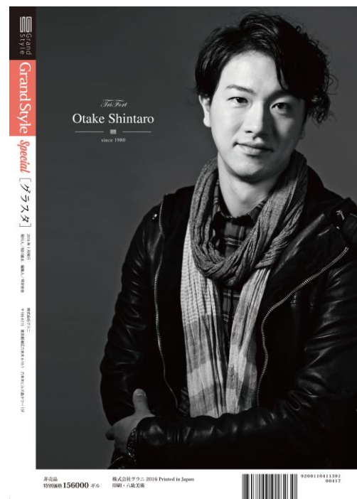
『Grand Style』特別号 裏表紙

株式会社グラニ(本社:東京都港区、代表取締役社長:谷 直史、以下グラニ)は、アプリ・ゲーム・IT 業界の社員・社風を紹介する業界誌、『Grand Style』(以下「グラスト」)の特別号を発行いたしました。