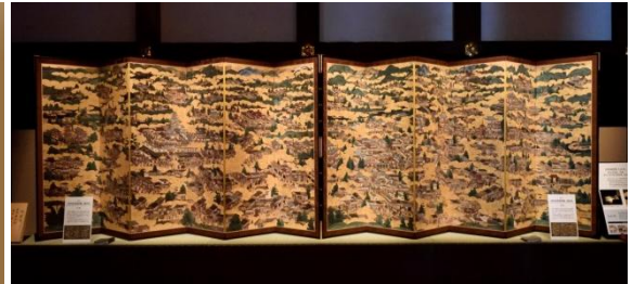
高精細複製「伝匠美」による「洛中洛外図屏風」