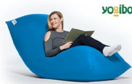
③ Yogibo Max