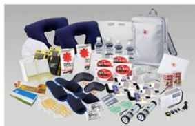
① リュックバッグ避難セット2人用

※①~②のいずれかの数字が記載されており、その数字に対応した賞品をプレゼントいたします。