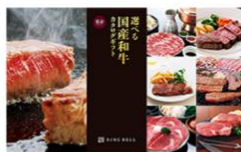
② 選べる国産和牛カタログギフト