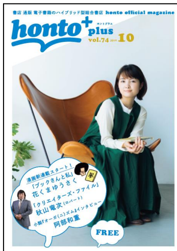
カバーモデル：葵わかな