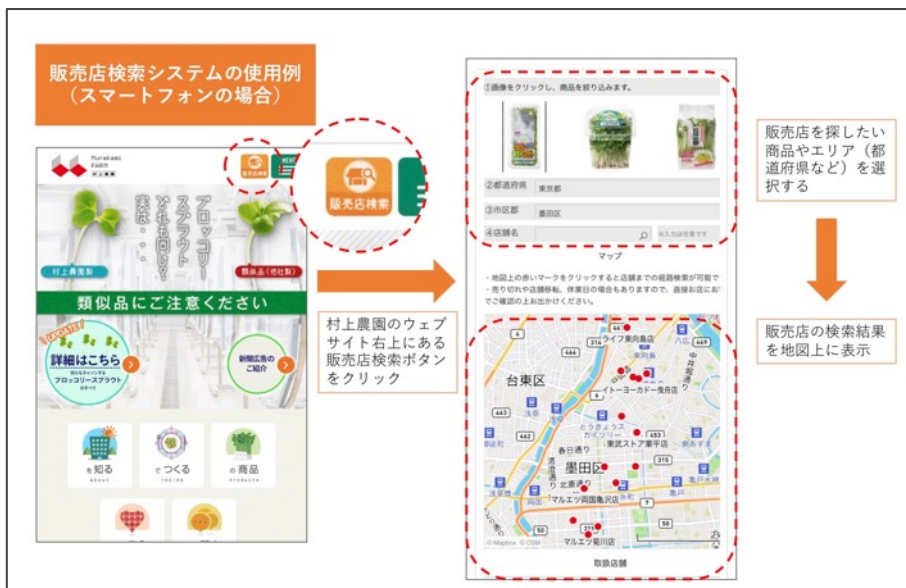
←販売店検索システムの使い方例 (スマートフォンの場合)