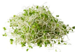
ブロッコリー スーパースプラウト