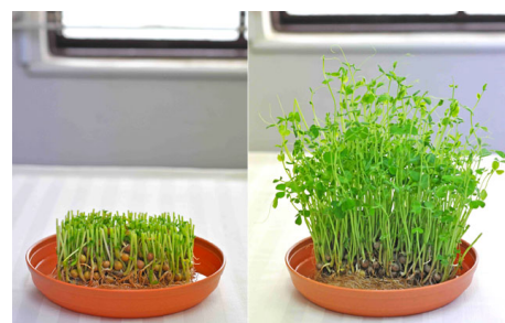
(図3) 豆苗の再生栽培

調理で残った豆苗の根元を水に浸して育てれば、新しい芽が伸びて、また食べることができます(図3)。