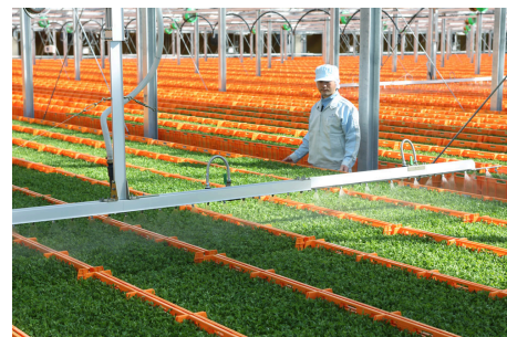
(図2) 村上農園山梨北杜生産センター

気候の影響を受けにくい施設栽培(図2)の豆苗は、年間を通じて生産ができ、安定価格で出荷しています。