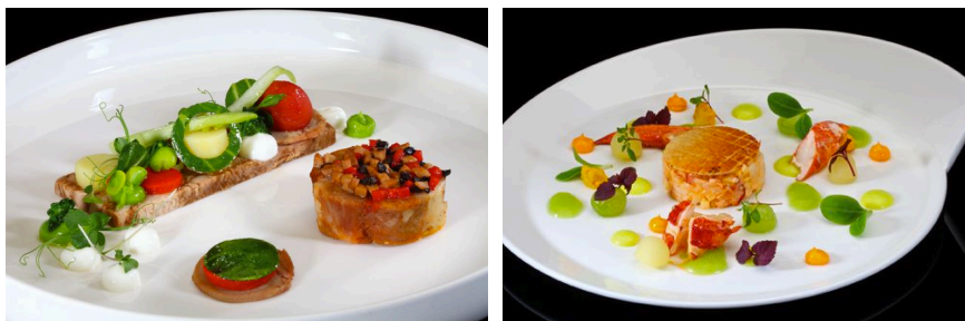
左:クレイジーピーなどを使用 右:ポリジなどを使用