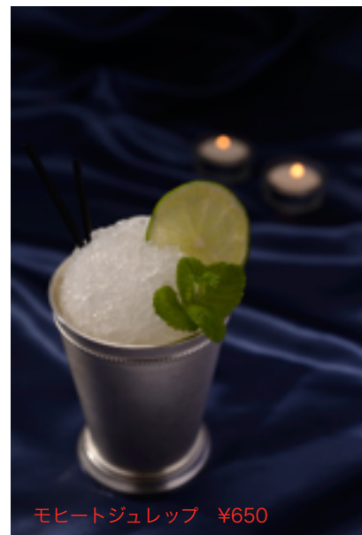
モヒートジュレップ ¥650