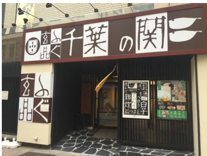
玄品ふぐ 千葉の関 入口イメージ

関東・関西を拠点に全国 91 店舗を展開する とらふぐ料理専門店「玄品ふぐ」、「玄品 以蟹茂」、「ふぐ・かに専門 玄品」（株式会社関門海、本社：大阪市西区、代表取締役社長：田中 正、以下玄品ふぐ）は、千葉県内第 4 号店となる【玄品ふぐ 千葉の関】を、2016年9月22日（木・祝）にオープン致します。