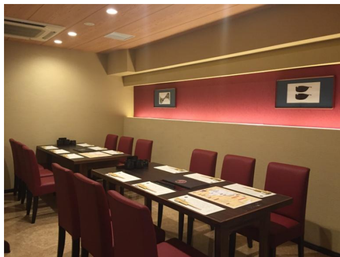
玄品ふぐ 千葉の関 店内イメージ