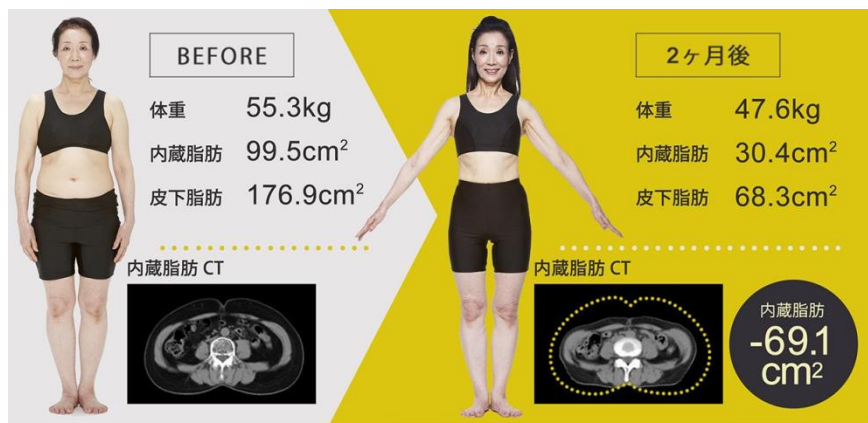
67歳女性が2ヶ月RIZAPに通った例 ※結果には個人差があります。

健康コーポレーション株式会社(本社・東京都新宿区、代表取締役社長 瀬戸 健)の子会社である RIZAP 株式会社は、シニア世代の方々にも健康的な体を手に入れられるようなプログラムを提供しています。8月7日(金)よりオンエアを開始している新CMには60代シニアモニター2名を起用しており、2ヶ月間のトレーニングに励んだ結果、見事ボディメイクに成功。男性モニターは体重が-11.5kg、内臓脂肪-127.6cm 2 という驚異的な結果を残しています。