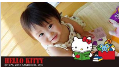
APPROVAL NO.E-520913-1