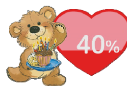
アイコンきせかえ