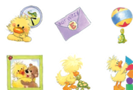
アイコンきせかえ