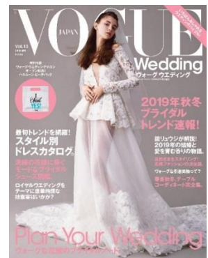
VOGUE Wedding Vol.13

「現在のウエディングの最も大きなキーワードは“価値観の多様化”です。今は、さまざまな価値観を持つ花嫁が、それぞれの個性を思い切り楽しむ時代。ヴォーグ ウエディングサロンでは、トラディショナルなウエディングドレス以外にも、多種多様なドレスを用意しました。アレキサンダー・マックイーンやジャンパティスタ ヴァリ、オスカー・デ・ラ・レンタ、セルジオ ロッシなど、『ヴォーグ』読者にはおなじみのモードな人気ブランドも揃います。ぜひ、既存のルールにとらわれない、“スタイルのあるドレス選び”を楽しんでいただけたらと思います。」