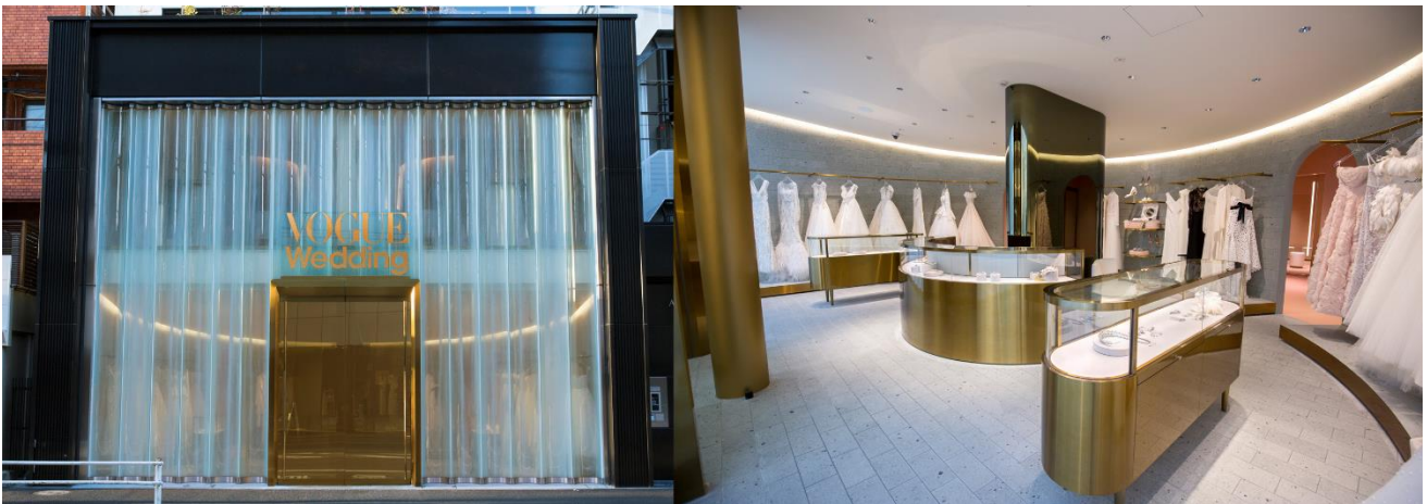
VOGUE Wedding

世界で最も影響力のあるファッション誌『VOGUE』がプロデュースする世界初となるドレスショップ「VOGUE Wedding Salon／ヴォーグ ウエディングサロン」が、2019年2月9日(土)にオープンいたします。表参道・骨董通りに面するウエディングサロンでは、モードな花嫁たちに贈る雑誌『VOGUE Wedding(ヴォーグ ウエディング)』の中に入り込んでヴォーグの世界を“体感”することができます。店内では、ドレスやアクセサリだけでなく、ヘアメイクやフォトサービスなど、スペシャルなウエディングをご提案します。